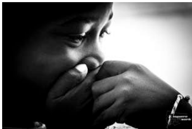
Visage d'enfant Photo de Malyka Diagana – LINGUERE Tous droits réservés. Linguere Artwork Photographik©

Une projection du travail effectué par les jeunes de Mboumba clôturera les ateliers du festival.